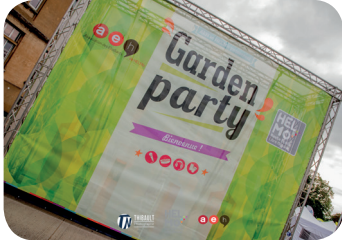
Garden Party 2017 : on y était bien ? p.3

EDITO • DOSSIERS • POINT CULTURE • INTERVIEWS • BRÈVES • JEUX