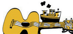
Ukulele sur Meuse : l'événement à découvrir ! p.5

V B A D O O U E E X K R R N X O E A J N P E D D E E I E U D J M W T I T V R U I J T E X E R A D E E P U N M T I B W P F A C D N T R N N C F A N M E O A E L O M I T T A N E L E J U S T O R R M E E L E M O D G O C A R E L G R R B C A V I O T W H O I I P R O C N W L H I C C N E U N E N K I O T E C O T O U N G Z A W A T B D I F A N H K R C H U Y U O G V U L D X M T Z Y Q L U Y F A N C Z D U X L I A C Y O B E C